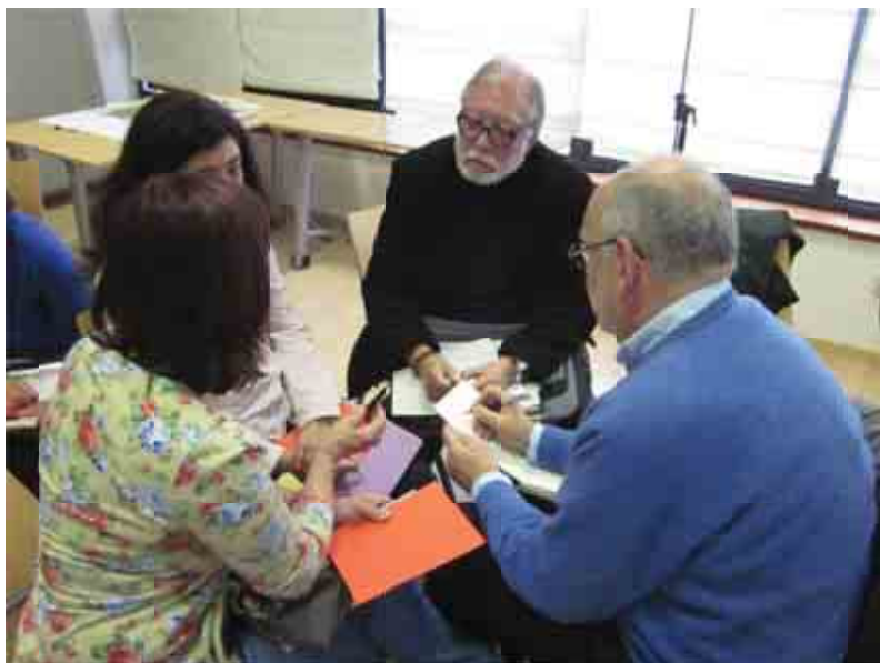
Foto 2. Un grupo reflexionando sobre los aspectos positivos y negativos de Torrelodones

Los participantes se organizan en grupos de tres o cuatro personas, y escogen tres aspectos positivos y tres negativos de la situación actual de Torrelodones.